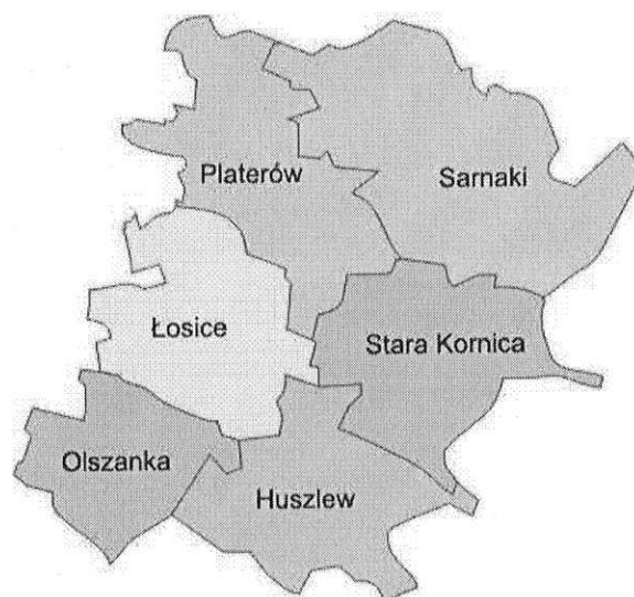
Rysunek 1. Powiat łosicki

Gmina Platerów sąsiaduje z następującymi gminami: Drohiczyn, Korczew, Łosice, Przesmyki, Sarnaki, Siemiatycze, Stara Kornica.